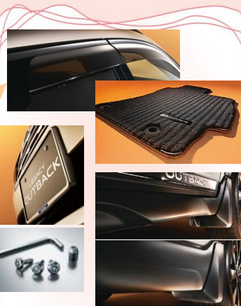
人気ランキング 3位