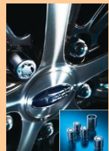
ホイールロックセット