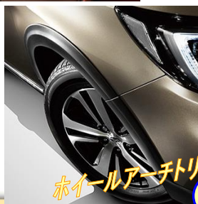
ホイールアーチトリム