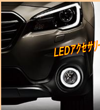
LEDアクセサリリング