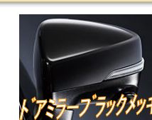
ドアミラーブラックメッキ