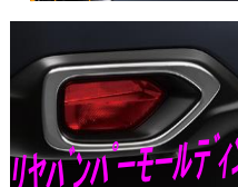
リヤバンパーモールディング