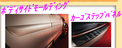
ボディサイドモールディング