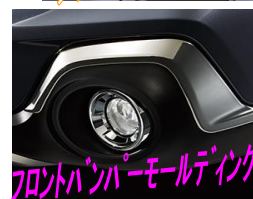
フロントバンパーモールディング